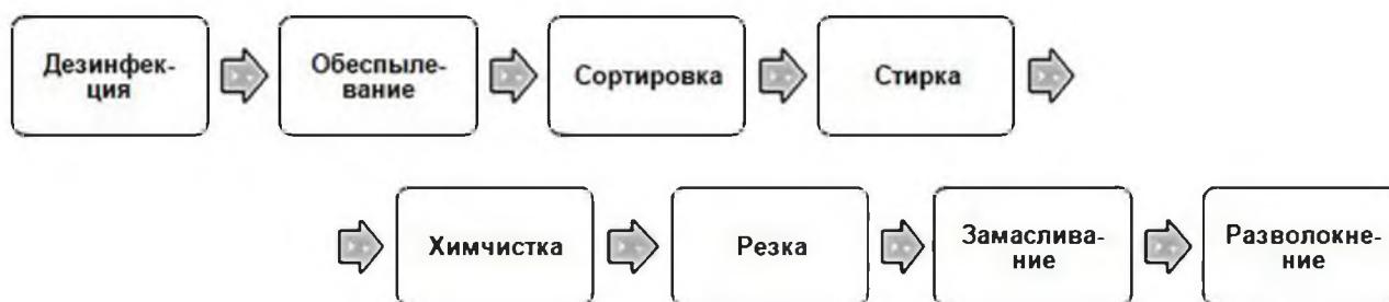
Рисунок 1 – Схема первичной обработки текстильных отходов

В случае отсутствия действующего на территории Беларуси государственного (межгосударственного) стандарта (СТБ, ГОСТ и т.п.) на изготавливаемую продукцию, производитель должен разработать свой ТНПА, одним из которых являются технические условия. На территории Республики Беларусь отсутствует ТНПА, устанавливающий технические требования к восстановленному текстильному волокну , полученному из текстильных отходов, поэтому разработаны технические требования в виде ТУ ВУ.