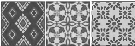
Рис. 1 – Варианты художественной стилизации фрагментарных мотивов слуцкого пояса

Основные характеристики построения рисунков: статическая монокомпозиция, составленная из квадратных мотивов с горизонтальной и вертикальной осями симметрии.