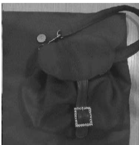
Рисунок 3. Модель кармана-сумки с креплением к одежде с помощью петель и пуговиц

На рисунке 3 представлена модель кармана-сумки в виде кошелка, фиксация которой осуществляется с помощью петель и пуговиц.