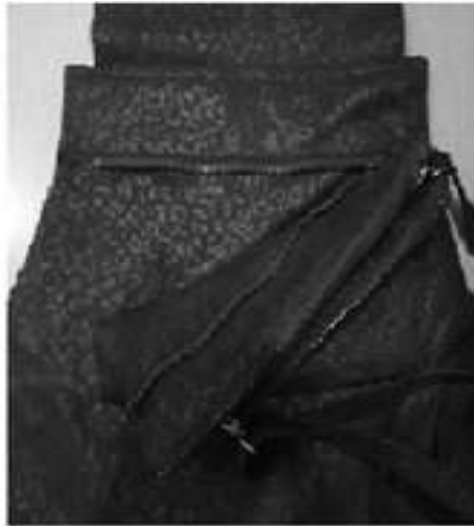
Рисунок 4. Модель кармана-сумки с креплением с помощью с помощью разъемной «тесьмы-молнии»

Предложенные съемные карманы-сумки как новый аксессуар добавит оригинальность гардеробу женщины или мужчины. Каждый раз пальто, комбинезон, жакет, платье и любое другое изделие будут выглядеть по-новому, выразительно и современно. При этом у потребителя всегда есть выбор и возможность подчеркнуть свою индивидуальность, расширить практическую значимость изделия.