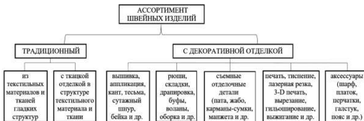
Рисунок 1. Виды декоративных отделок в одежде

оказывается заведомо беспроигрышной. При этом как показывает практика спрос на такое изделие, растет, тем самым делая его конкурентоспособным.