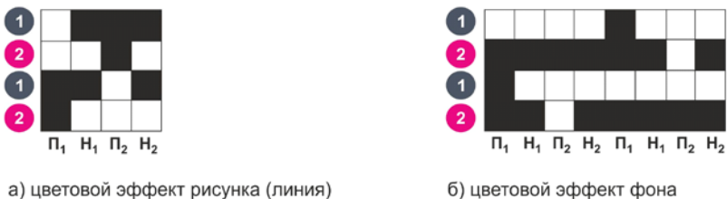
Рис. 1 Модельные переплетения для изготовления шарфа на ткацком станке

программным управлением SLXP 540/1 S 550; жаккардовой машиной с программным управлением LX 1602 фирмы Staubli (Рис. 1).