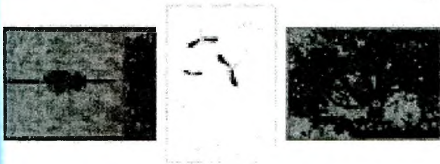
Рисунок 2 – Комплект полотенец.

качественного и четкого изображения как в орнаменте, так и в изобразительных мотивах.