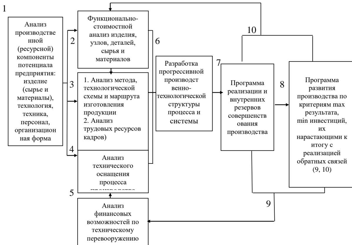
Рисунок 3. – Модель разработки программ развития и реализации резервов совершенствования производственной компоненты потенциала предприятия

Как показывают результаты исследования, практически все анализируемые предприятия по основным компонентам организационного потенциала максимально задействуют резервы использования производственного и материального потенциалов. По нашему мнению, это обусловлено: