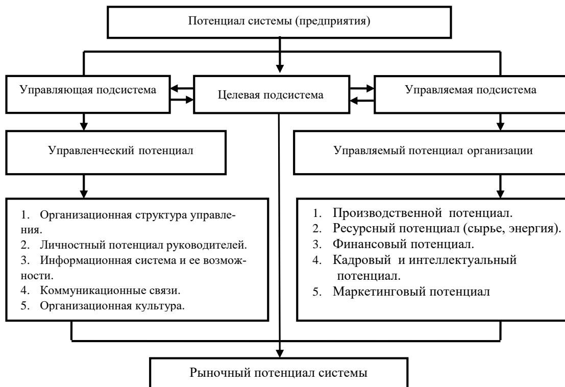
Рисунок 1. – Модель взаимосвязи элементов потенциала системы как хозяйствующего субъекта

Однако, использование управленческого потенциала предприятий необходимо рассматривать в тесной взаимосвязи компетентности руководства с эффективностью развития предприятия. Формирование управленческого потенциала предприятия является важным направлением реализации стратегии и предполагает создание и совершенствование профессионализма персонала, правил, процедур, операций в системе управленческой деятельности для достижения целей деятельности предприятия и успешного его функционирования. В этой связи, наш подход к разработке методик анализа основан на том, что потенциал системы – это симбиоз управляемого потенциала организации и управленческого потенциала с учетом их взаимопроникновения и целевого взаимодействия (рисунок 1).