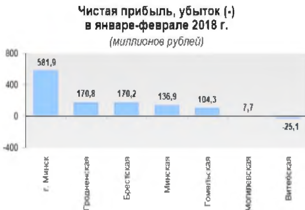
Рисунок 2 – Чистая прибыль (убыток) в январе-феврале 2018 г.

Существенно различаются внутриреспубликанские области по прибыли и убыткам. Наиболее высокими в рассматриваемый период были в городе Минске, Гродненской и Брестской областях и сравнительно низкими в Могилевской (7,7 млн.р.) и Витебской (-25,1) областях (рисунок 2).