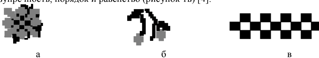
Рисунок 1 – Варианты орнамента: виды стилизации василька: цветки (а), бутоны (б) и кайма (в)

определяет четырехчастность любых структур и процессов, мистический союз четырех стихий, служит формообразующим элементом зданий и сооружений и определяет совершенство, статичную безупречность, порядок и равенство (рисунок 1в) [4].