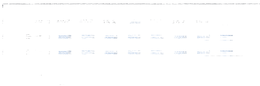
Рис. 1. Производство обуви

До 2011 г. объёмы производства обуви ежегодно возрастали и колебались в пределах 15–17 млн пар в год. Тем не менее, начиная с 2011 г. наблюдается тенденция снижения объёмов производства обуви (рис. 1).