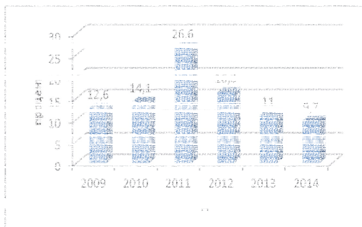
Рис. 3. Рентабельность продаж по виду экономической деятельности «производство кожи, изделий из кожи и производство обуви»

Рентабельность продаж по виду экономической деятельности «Производство кожи, изделий из кожи и производство обуви» также снижается, отражено на рисунке 3.