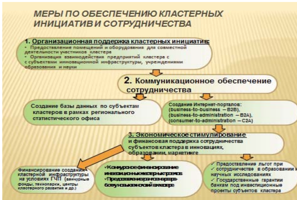
Рис. 4. Рекомендуемые меры по обеспечению кластерных инициатив и сотрудничества

Институциональный механизм формирования обувного кластера в Витебском регионе. В целях формирования кластерных инициатив и сотрудничества необходимы меры организационной, коммуникационной поддержки и экономического стимулирования (рис. 4).